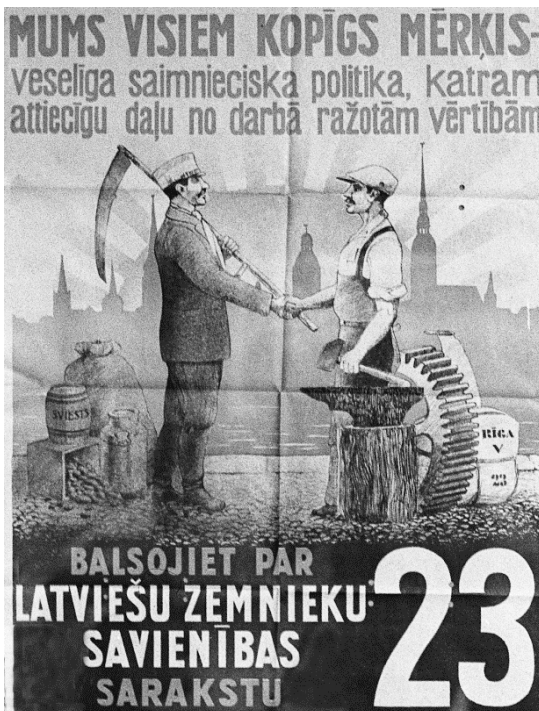
Latviešu zemnieku savienības vēlēšanu plakāts