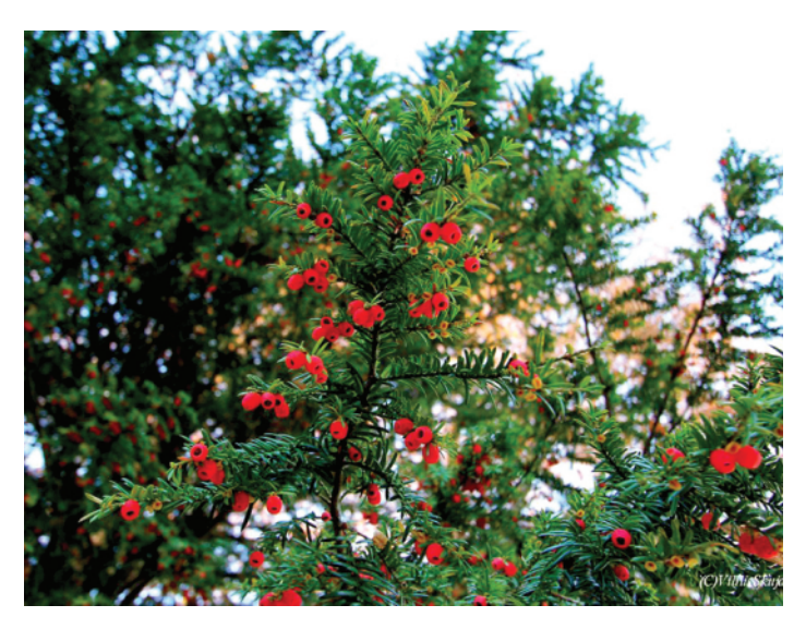
Parastā īve (Slīteres nacionālajā parkā)