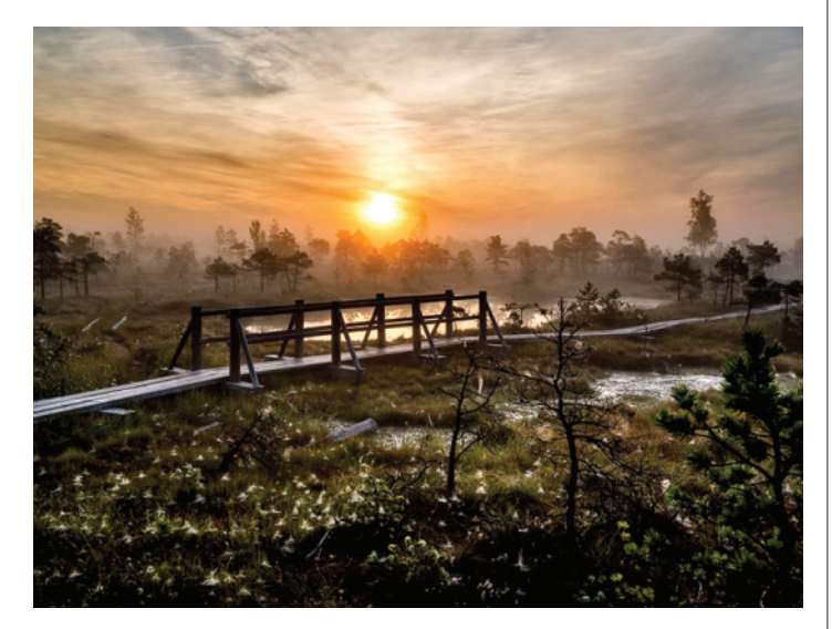
Lielais Ķemeru tīrelis (Ķemeru nacionālajā parkā)