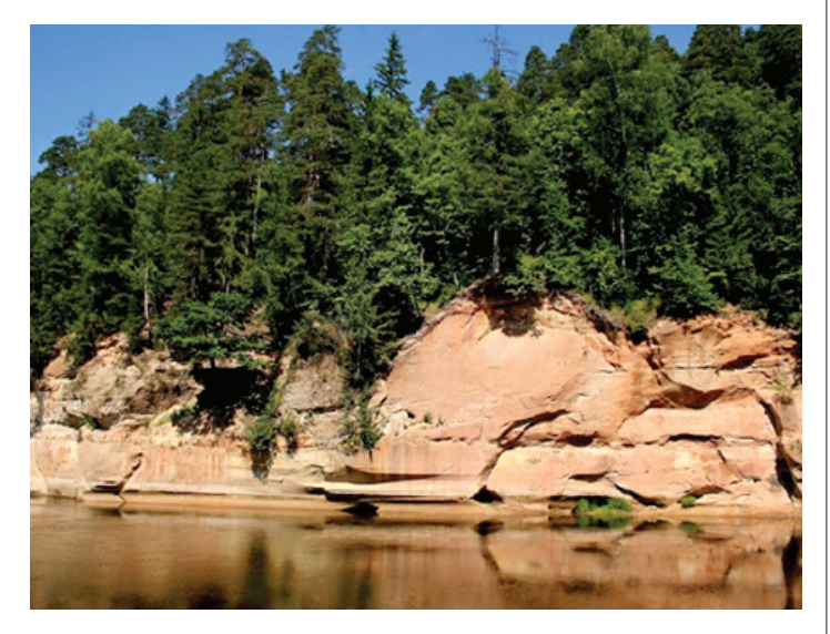
Velnalas klintis Siguldā (Gaujas nacionālajā parkā)