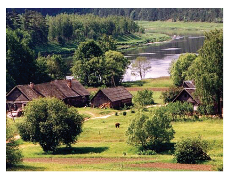
Skats no Lielā Liepu kalna (Rāznas nacionālajā parkā)